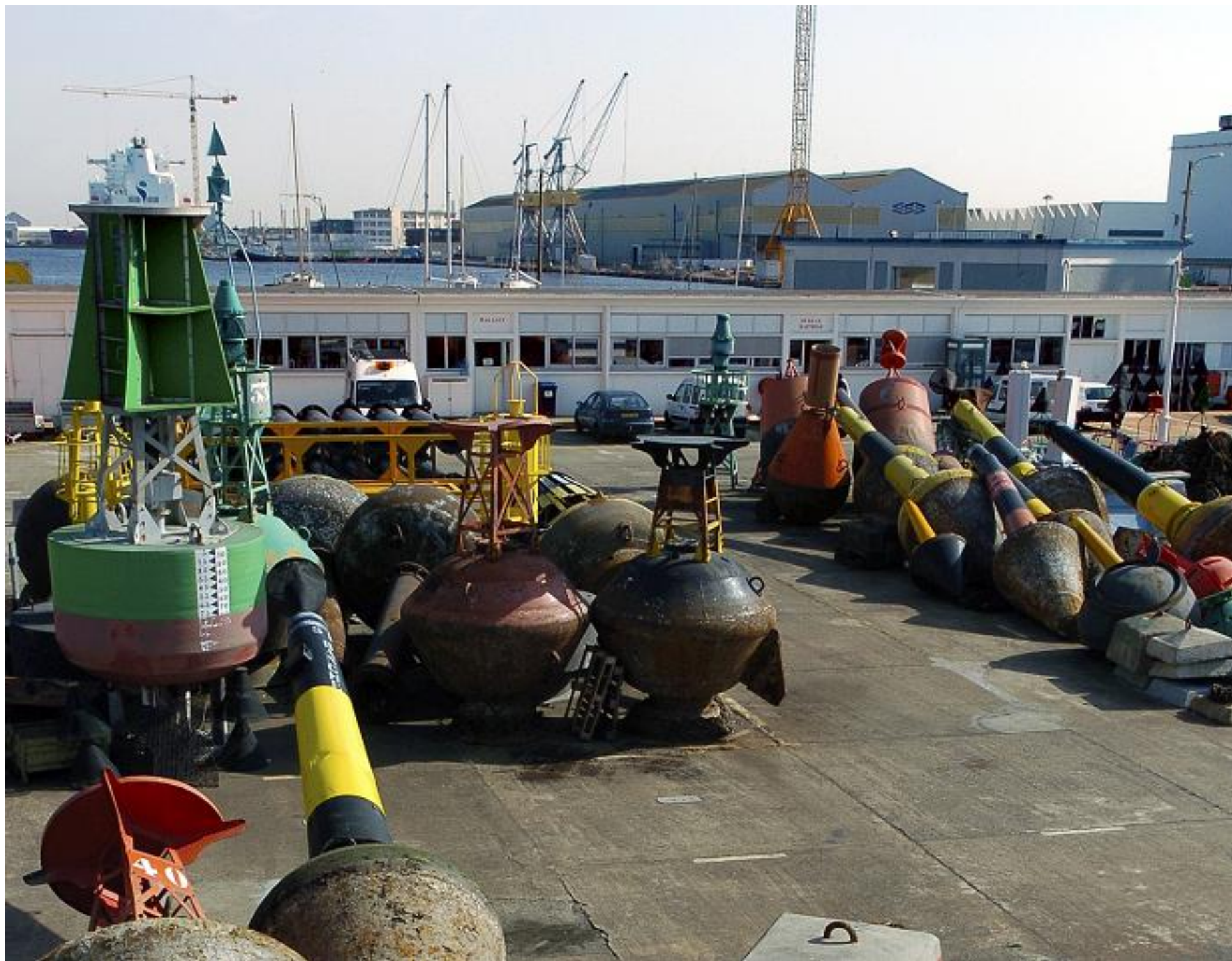
Colloque coopération ST 2011 12 09